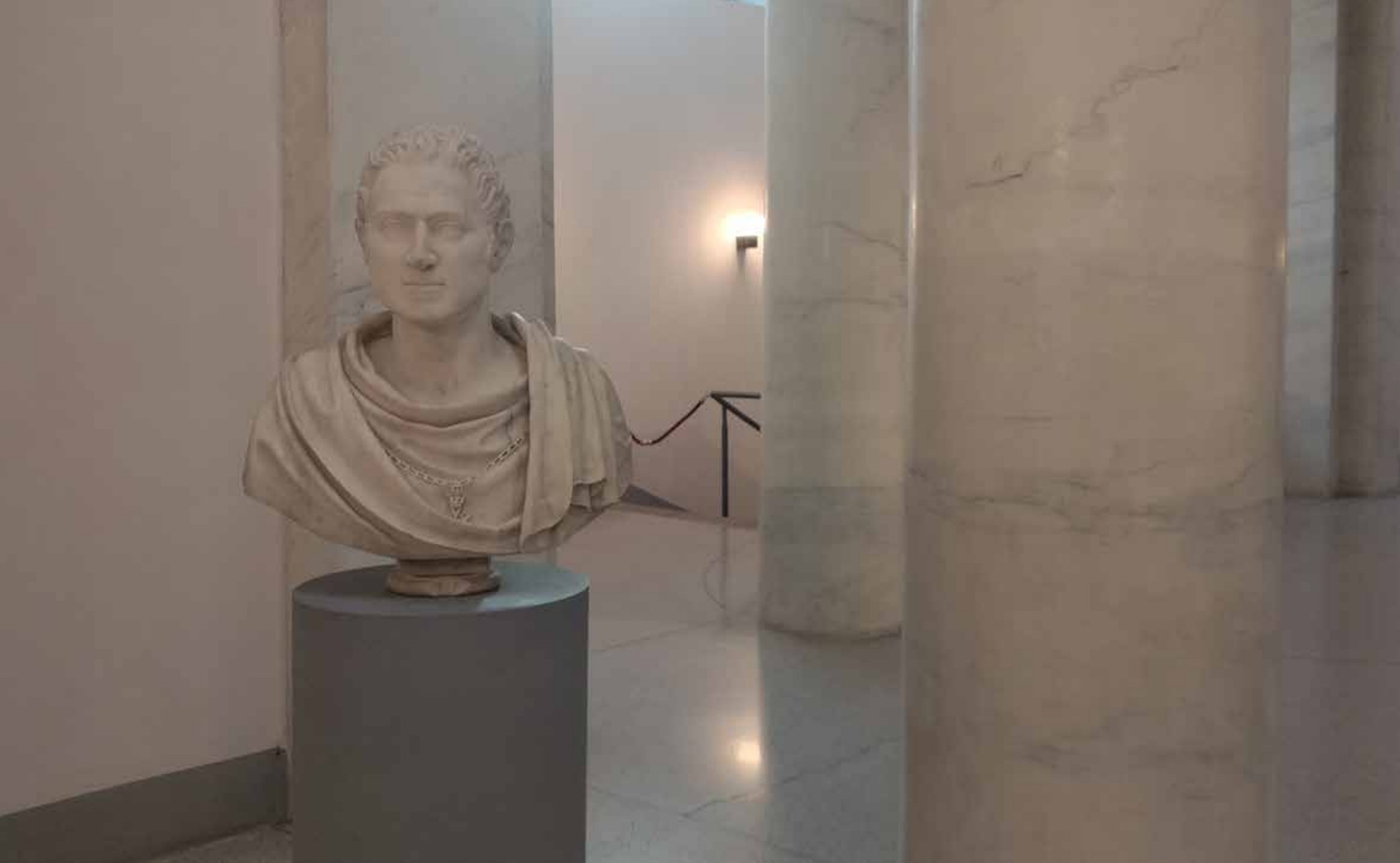
ECCO IL BUSTO DEL MARCHESE