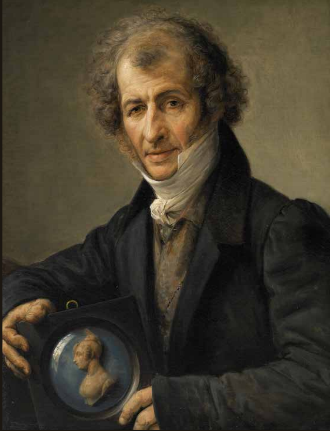
IL "RITRATTO DI GIOVANNI BELTRAMI" È DIPINTO DAL PICCIO. IL PICCIO È UN PITTORE ORIGINARIO DEL TERRITORIO CREMONESE