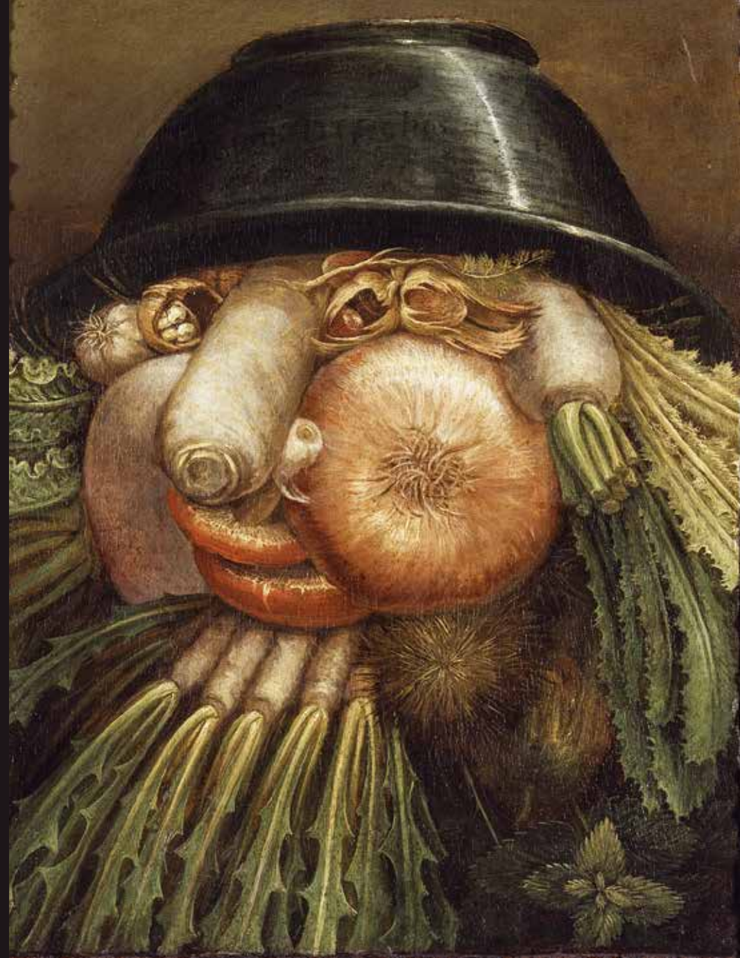
"L'ORTOLANO" DI GIUSEPPE ARCIMBOLDI È UN QUADRO CHE SE LO GUARDI IN UN SENSO VEDI UN CESTO DI FRUTTA E VERDURA. SE LO GUARDI AL CONTRARIO VEDI UNA FACCIA BUFFA